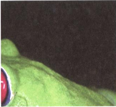
PARTE AMPLIADA DO CORPO DO ANIMAL

QUE ANIMAL É ESSE? FAÇA UM CÍRCULO NA IMAGEM DO ANIMAL CORRESPONDENTE: